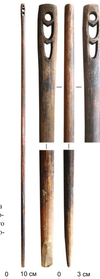
Рис. 2. Посох жреца из хозяйственной постройки 10 остяцкого квартала I Надымского городка.

Посох 1. Он представляет собой тонкую жердь овального сечения, увенчанную ажурным зооморфным навершием (рис. 2). Общая длина изделия 154 см. Для удобства описания посох условно разделен на три части. В верхней части с помощью трех сквозных отверстий переданы две сопоставленные фигуры животных: круглое формирует головы, полуовальные –