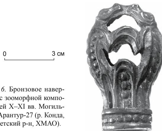
Рис. 6. Бронзовое навершие с зооморфной композицией X–XI вв. Могильник Арантур-27 (р. Конда, Советский р-н, ХМАО).

В завершение можно сделать еще один вывод о религиозных воззрениях жителей Надымского городка. Правда, основанный только на археологических источниках, он может показаться малоубедительным. Тем не менее обращу особое внимание на уникальную особенность культурного слоя Надымского городка – замерзшее состояние. Накапливаясь и замерзая, слой не оттаивал, и вещи в нем не перемещались. Именно это обстоятельство позволяет делать некоторые выводы не только по наличию артефактов, но и по их отсутствию. К категории культовых предметов и принадлежностей ритуалов в настоящее время отнесено ок. 200 изделий, и это не считая вещей из категории детских игрушек (ок. 1 500 экз.), в рамках которой сложно дифференцировать бытовые предметы и тотемные, а последние могут составлять не менее половины. Сле-