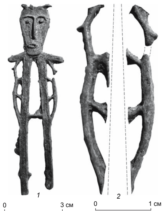
Рис. 5. Культовая антропоморфная скульптура из бронзы. Белоярская археологическая культура (VII–IV вв. до н.э.). Городище Стрелка (р. Большой Юган, Сургутский р-н, ХМАО). 1 – скульптура; 2 – ее зооморфные элементы – модель сопоставления фигурок зверьков.

Семантика подобных изображений достаточно подробно рассмотрена А. Голаном [1993, с. 160–163, рис. 340–359]. Если обобщить результаты его анализа, то подавляющее большинство парных сопоставленных фигур животных можно интерпретировать как элементы божественной триады, символизирующие стражей верховного божества (богини) или близнецов – детей верховной богини. Разнополюе фигурки в данном контексте олицетворяют идею божественного плодородия [Там же, с. 161–162]. Такая трактовка парных зооморфных изображений всецело согласуется с системой религиозных представлений коренных народов Сибири, взаимосвязанной с шаманской ритуальной практикой, в которой используется посох.