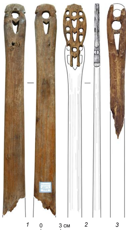
Рис. 3. Фрагменты посохов жреца из Надымского городка.

По фрагменту реконструируется посох в форме тонкой жерди овального сечения с ажурным зооморфным навершием (рис. 3, 1). Общий размер изделия определить невозможно. Верхняя часть имеет длину в пределах 8 см, ширину 3,5, толщину 1,4 см. В навершии с помощью двух сквозных отверстий переданы две сопоставленные фигуры животных: круглое формирует головы, полуовальное – лапы и туловище. Поперечными нарезками с наружной стороны изображений обозначены шея и короткие уши. Степень стилизации очень велика, видовую принадлежность изображенных животных к небольшим хищникам можно определить только по близости иконографии этих изображений к вышеописанным на посохе 1. Размер фигурок соответствует длине верхней части, определенной по сужению предмета до 2,8×1,5 см. Ниже размер сечения увеличивается и у обломанного конца составляет 3,4×1,9 см.