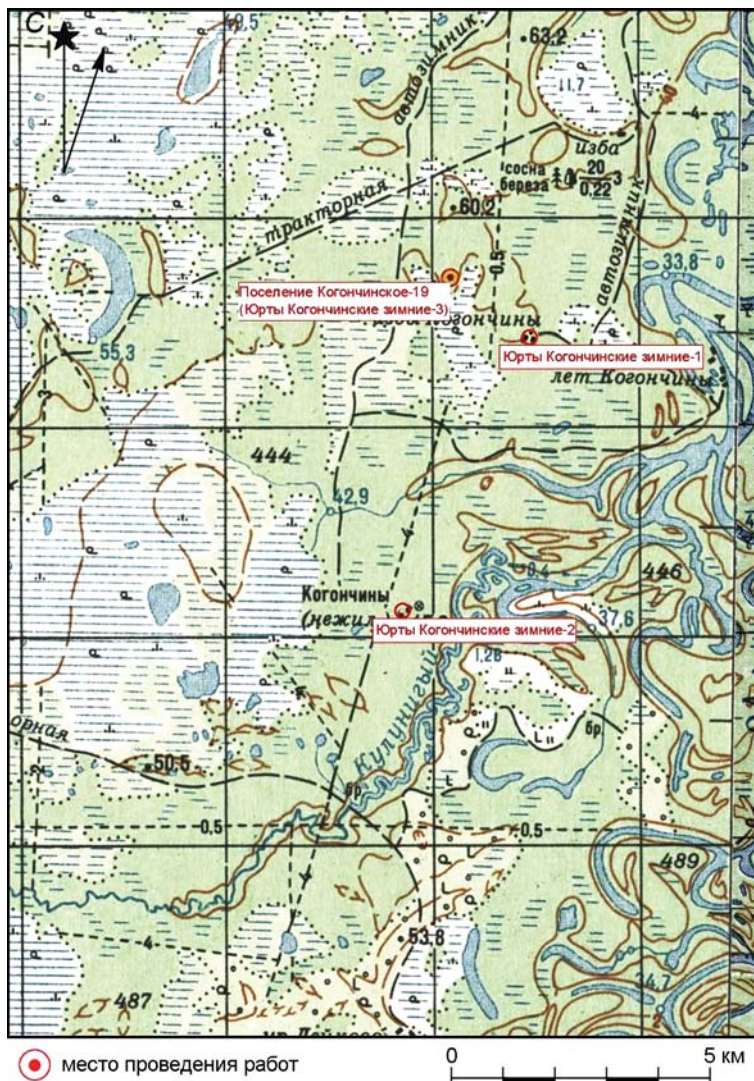
Рис. 1. Поселение Когончинское-19 (ХМАО – Югра, Сургутский р-н). Топоплан. М 1: 500.

По результатам исследований сооружение № 1 реконструируется как наземное бревенчатое срубное строение размерами 5,9 × 5,9 м. Конструкция была поставлена без фундамента, прямо на землю. Интерьер постройки состоял из нар, расположенных вдоль трех сторон жилой камеры, а также чувала. Пол был земляным, о чем свидетельствует прослойка темно-серого песка с вкраплениями угля. Нары были приподняты над уровнем пола на 0,3–0,4 м. Они были ограничены досками, поставленными на ребро. Возможно, нары были покрыты деревянным настилом либо застелены берестой, камышовыми циновками, оленьими шкурами – этот материал не сохранился. Из ям, расположенных вдоль западного и восточного краев постройки, брали грунт для завалинки, остатки ко-