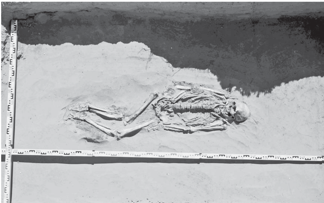
Рис. 3. Погр. 1.2. Вид с запада. Могильник Бухта Находка-2.

Вторая группа представлена десятью погребениями XII–XIII вв. Костные остатки содержались в четырех из них, два погребения повреждены эрозией, остальные четыре – кенотафы.