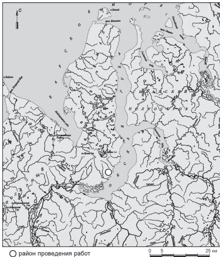
Рис. 1. Расположение могильника Бухта Находка-2.