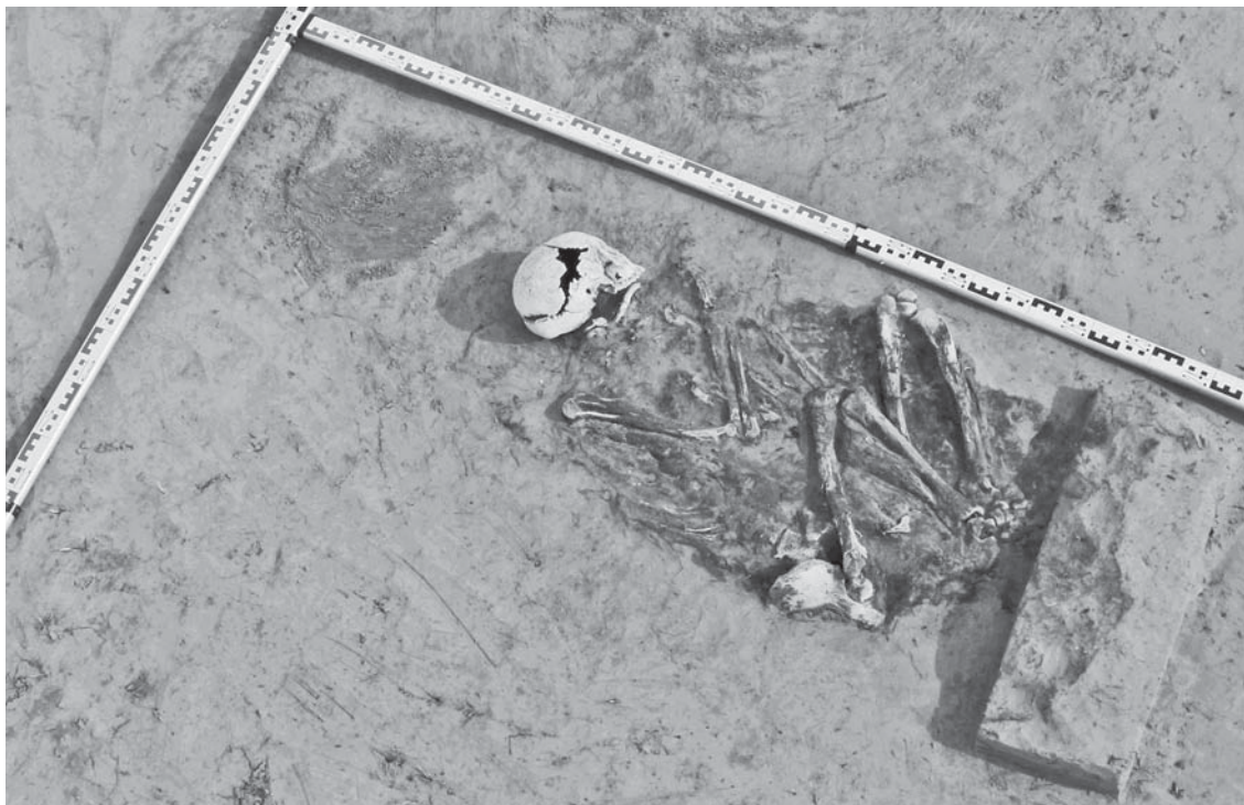
Рис. 5. Погр. 2.1. Вид с юга. Могильник Бухта Находка-2.

го саркофага. Лицо закрывал головной убор ворсом внутрь. Сверток был уложен в деревянную конструкцию, верхняя часть которой сохранилась в виде широкой плахи, остальное – в виде древесного тлена. В меховом свертке обнаружен скелет, кости расположены в анатомическом порядке. Погребенный был уложен на спину, руки вытянуты вдоль туловища, ноги прямые. Сопроводительный инвентарь представлен однобусинными височными кольцами, различными подвесками и бляшками, пластиной, фрагментами стенок медного котла, ушком котла и конусом, свернутым из фрагмента стенки котла, который также указывает на особую значимость данного захоронения. Подобные конусы К.А. Руденко называет сосудами-символами; встречаются они крайне редко, известны в погребениях Кузьминского могильника в Прикамье, датированы концом XI – XII в. [Руденко, 2000, с. 41, 103, рис. 4]. Подобное изделие было обнаружено в могильнике Зеленый Яр и датировано XIII в. [Зеленый яр..., 2005, с. 112].